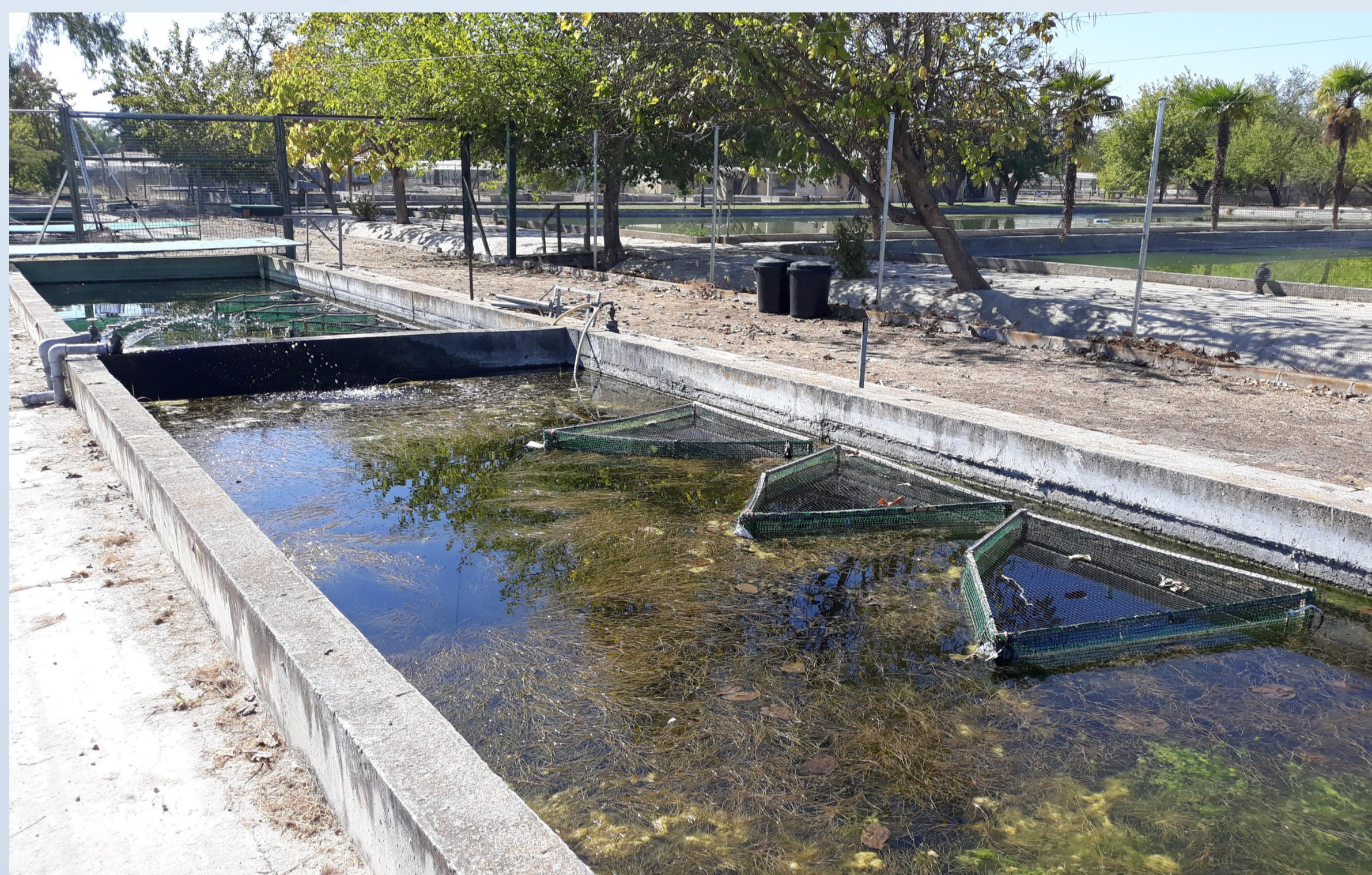
Figura 1. Estanques y nasas utilizadas en el ensayo.

Se seleccionaron 505 tencas 1+ de edad, con un peso medio de 24,04 ± 0,13 g. Los peces se marcaron individualmente con microchip (PitTag) (Mahapatra et al., 2001), repartidas de forma homogénea en 9 lotes y distribuidas en 3 estanques independientes de 30 m 2 de superficie con fondo de tierra y 1 m de profundidad. En cada uno de estos estanques se anclaron al fondo 3 nasas o jaulas con un volumen aproximado de 725 L cada una. Uno de los estanques fue ocupado enteramente con machos, otro con hembras y finalmente, un tercero con 3 nasas constituidas por lotes mixtos.